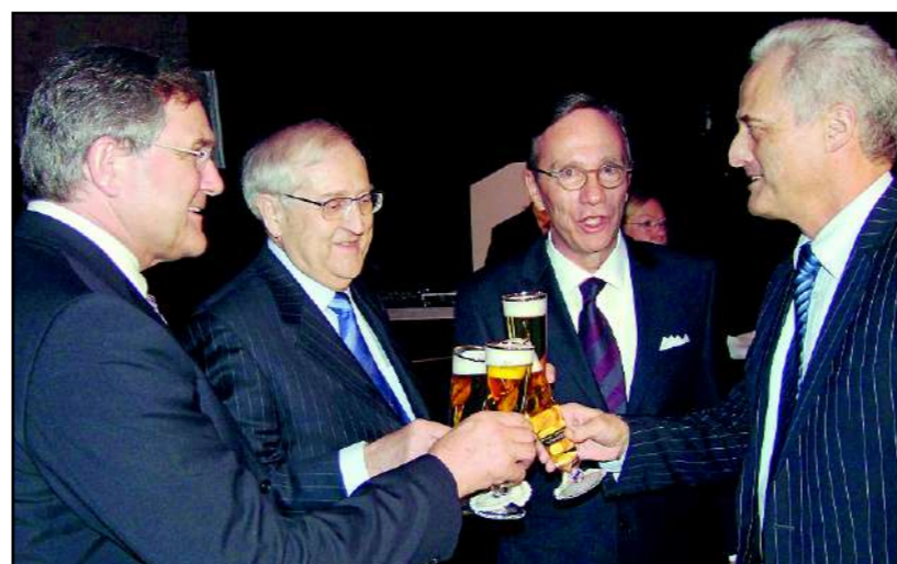
Politik trifft Wirtschaft in Berlin: Empfang beim Verband der Automobilindustrie VDA mit Ex-Verteidigungsminister Franz-Josef Jung, Wirtschaftsminister Rainer Brüderle, VDA-Präsident Matthias Wissmann und Verkehrsminister Peter Ramsauer (linkes Bild von links); Sommerfest in der niedersächsischen Landesvertretung mit VW-Chef Martin Winterkorn und Ministerpräsident David McAllister (rechts)

Unter Lobbyismus versteht man die Gepflogenheiten von verschiedenen Interessengruppen, Regierungsmitglieder und Gesetzgeber zu beeinflussen.