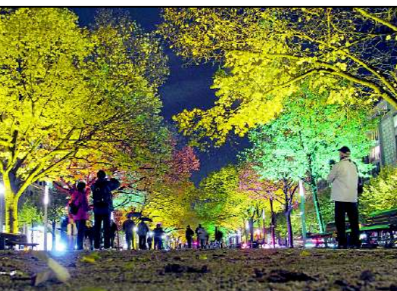
Unter den Linden: Der Boulevard wird von den Lobbymeilen in der Bundeshauptstadt

Europa und die Globalisierung, Liberalisierungsgesetze und die digitale Revolution haben das Lobbyistenheer an die Wirtschaftswelt heran gelassen. Immer neue Akteure sind hinzugekommen, weil neue Branchen entstanden sind und neue Themen und Probleme die Gesellschaft bewegen. Mehr als 2.000 Verbände sind auf der Liste des Bundestages registriert, von A wie ABDA (Bundesvereinigung der Arbeitgeverbände) bis Z wie ZIV (Industrieverband für Zweiräder). Auch die zivilgesellschaftlichen Organisationen, die für Umweltschutz,