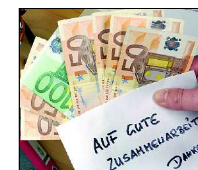
Kleine Geschenke: Sieben von zehn Befragten glauben, dass die Bestechlichkeit in Deutschland zugenommen hat

■ Die Verbändeliste im Internet www.bundestag.de/dokumente/lobby/index.html